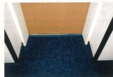
設置場所の形に合わせてカット可能です。